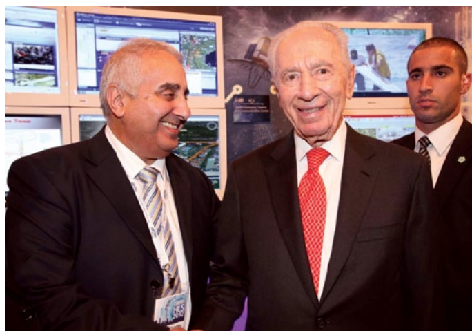
שמעון פרס, נשיא המדינה, מבקר בתערוכת HLS 2012

להלן פירוט יחידות השירותים המקצועיים: יחידת המידע והמודיעין העסקי מעמידה לרשות היצואנים מקורות מידע איכותיים - מאגרי מידע מקוונים, ספרייה עסקית באינטרנט, פעילות מקצועית של צוות מידענים, וכן קשר עם נספחים מסחריים ונציגים כלכליים של ישראל ברחבי העולם, ועם איגודים מקצועיים וארגונים בין-לאומיים נוספים. כל אלה מאפשרים ליצואן לבחון ולהתאים את פעילותו בחו"ל אל מול המציאות בארצות היעד, להכיר את מבנה השוק ואת הרגולציה, ולקבל מידע על מתחרים, על סוכנים, על מפיצים, ועוד.