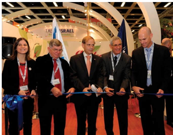
השקת הביתן הישראלי בתערוכת Fruit Logistica 2014, ברלין, גרמניה

יחידת שירותי הייעוץ נותנת מענה מקצועי לפניית היצואנים בכל הנושאים, הקשורים לתחומי היצוא והיבוא. היחידה מספקת ייעוץ בנושאים הבאים: הסכמי סחר וכללי מקור כולל ביצוע בדיקות אימות לרשויות מכס בעולם, תעריפי מכס, חוקיות היצוא והיבוא, תובלה ולוגיסטיקה בין-לאומיות, תקינה בין-לאומית, ביטוח ימי ואווירי, שיטות תשלום, שיווק בין-לאומי, ייעוץ בבניית אתר אינטרנט במדינת היעד (כגון סין), ועוד.