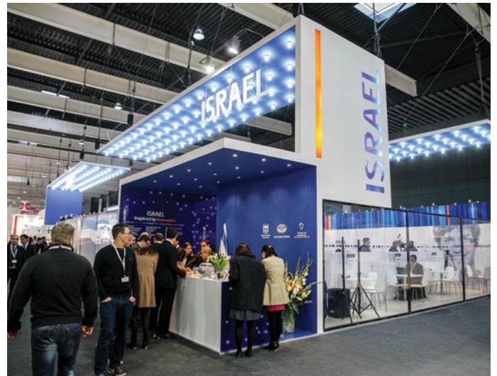
תערוכת MWC 2013, ברצלונה, ספרד

לפרטים נוספים, צפו באתר האינטרנט: www.export.gov.il .