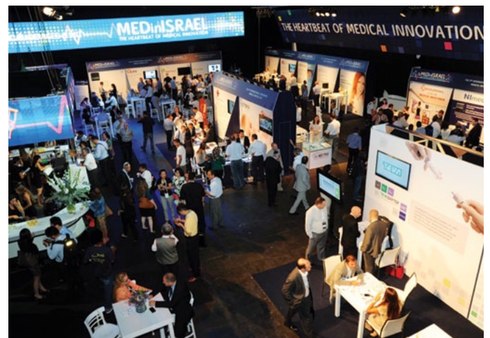
תערוכת MEDinISRAEL 2013

"הנהלת מכון היצוא משקיעה מחשבה מעמיקה באיתור תחומים חדשים ונושאים רלוונטיים, והיא פועלת לקדם באמצעות יזום אירועים בין-לאומיים בישראל ובעולם"