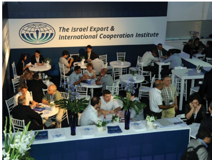
מפגש אנשי עסקים בחסות מכון היצוא, תערוכת MEDinISRAEL 2013

"אחד מן התפקידים שלנו הוא לקדם את מנועי הצמיחה של ישראל ולהביאם לחזית הבמה. מנועי הצמיחה הם התחומים, שבהם יש לישראל יתרון יחסי בעולם וערך-מוסף ברמה הבין-לאומית"