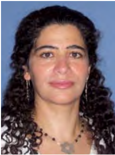
המרכז להשתלמויות בר-אילן חברה למחקר ופיתוח בע"מ אוניברסיטת בר-אילן www.bihh.co.il