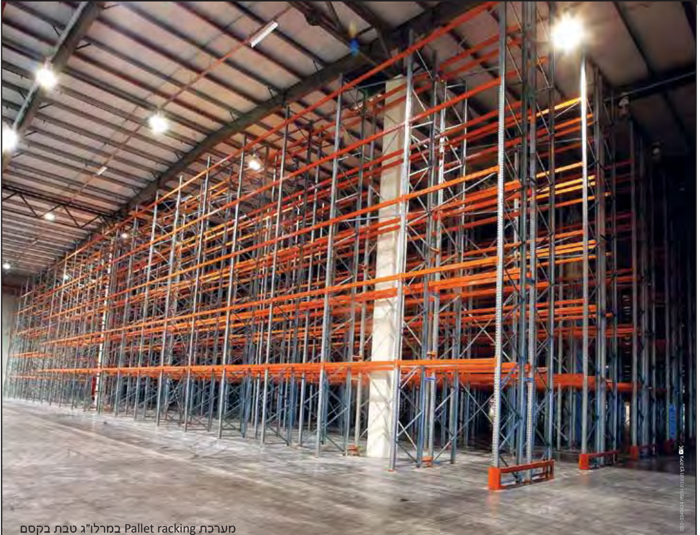
מערכת Pallet racking במרלוג"ג טבת בקסם