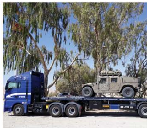
שירותי שינוע ותובלה יבשתית