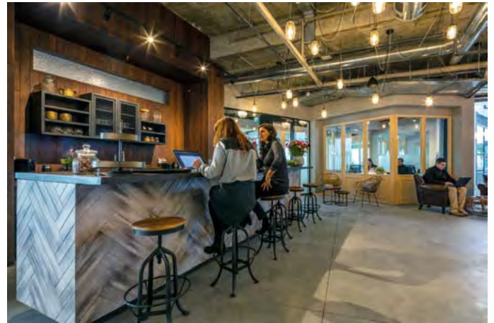
פרויקט "אייכה".

תדהר עבודות גמר מציעה פתרון מלא במסלול Turn Key. מסלול זה כולל חבילת פתרונות מקיפה, החל מן הפרוגרמה ואפיון הצרכים; המשך בפעילויות התכנון, התיאום והביצוע; ועד אספקת חלל מושלם - כולל: עיצוב, ריהוט, אבזור, וסיוע בהעברת ציוד למבנה החדש. הפתרון ניתן בפרק זמן קצר ביותר ומוגדר מראש, ובמחיר מוסכם וסגור. הערך ללקוח במסלול זה הוא עצום: הוא נהנה מסטנדרטים של תכנון ושל ביצוע ברמות הגבוהות ביותר, ובין-השאר, בזכות שימוש בטכנולוגיית בניין-מידול-מידע (Building information Modeling [BIM]*); ונוסף על-כך, הוא מקבל: קשת של שירותים ושל פתרונות ייחודיים, המותאמים לצרכיו ולטעמו האישי; לוחות זמנים קצרים וביטחון מלא במועד סיום הפרויקט; תקציב סגור, ידוע מראש, וללא הפתעות; ושקט נפשי, בזכות גורם מקצועי יחיד, המלווה את הלקוח לאורך כל הדרך.