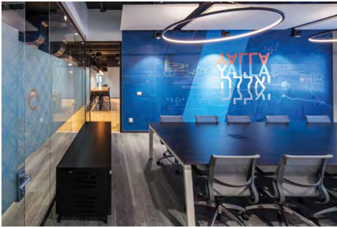
פרויקט "אאוטבריין".

המוצרים, השירותים, שיטות הייצור, והחידושים השונים בתחום; כמות הביקורים בשטח; כמות ההזדמנויות לעובדים; וכו'. המחלקה משקיעה מאמץ גדול בהכשרת עובדיה, כדי להביאם לחזית החדשנות המקצועית. הכשרה זו כוללת מתן כלים חינוכיים לעובד בתחילת עבודתו; הסמכתו לבצע את תפקידו; חניכתו וחפיפתו; וכן הדרכות פנימיות וחיצוניות, התורמות לפיתוחו המקצועי. כל אלה מאפשרים לעובדי המחלקה להתמודד עם האתגרים המורכבים ביותר ולחתור למצוינות ברמה עולמית". ■