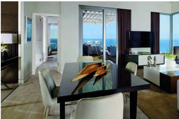
פרויקט "ריץ-קרלטון" בהרצליה.

המוצרים, השירותים, שיטות הייצור, והחידושים השונים בתחום; כמות הביקורים בשטח; כמות ההזדמנויות לעובדים; וכו'. המחלקה משקיעה מאמץ גדול בהכשרת עובדיה, כדי להביאם לחזית החדשנות המקצועית. הכשרה זו כוללת מתן כלים חינוכיים לעובד בתחילת עבודתו; הסמכתו לבצע את תפקידו; חניכתו וחפיפתו; וכן הדרכות פנימיות וחיצוניות, התורמות לפיתוחו המקצועי. כל אלה מאפשרים לעובדי המחלקה להתמודד עם האתגרים המורכבים ביותר ולחתור למצוינות ברמה עולמית". ■